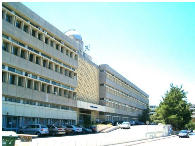
Εικ. 2: Φωτογραφία της κυρίας εισόδου του κτιρίου του Τμήματος Φυσικής του ΕΚΠΑ. Στην οροφή διακρίνεται το Γεροσταθοπούλειο Πανεπιστημιακό Αστεροσκοπείο.